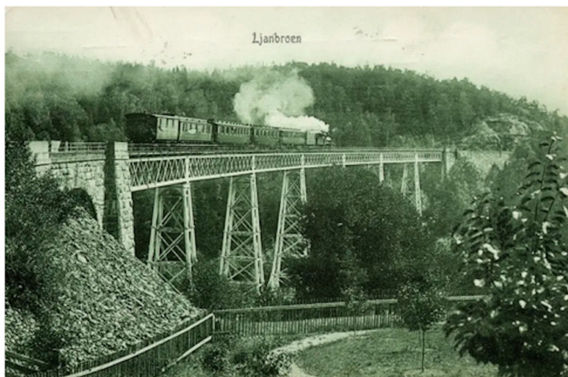
Ljansviadukten. Den sto ferdig i 1876 og fraktet Smålensbanen over Liadalen på vei mellom Ljan stasjon og Kolbotn. Her på et postkort fra ca. 1910.

Det skal vise seg at turen har flere wow-opplevelser å by på. Vi står på toppen av et enormt brokar av stein. Det er ett av fire som fortsatt står igjen etter den 236 meter lange jernbanebroen som fraktet Smålensbanen trygt over dalen her for 200 år siden. Det er lett å se for seg jernbanesporet som på det høyeste gikk 36 meter over bakken her.