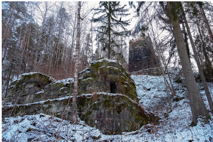
Restene. Mange foreldre var lettet da den 36 meter høye broen ble destruert i 1929. Barna brukte den nemlig som skolevei. Hullet på brokaret er kuttammer: i tilfelle det skulle bli nødvendig å sprengre broen ved en invasjon.