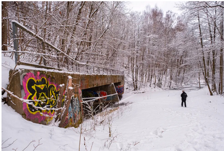
I fjell. Nederste del av elven ligger i kulvert. Da man oppdaget fisk som sto rett nedenfor den fire meter høye muren innenfor åpningen på Ljan, ble det bygget fisketrapp.

Vi finner frem sitteunderlag og termos og slår oss ned ved den frosne elvebredden. Kulden er en dyktig skulptør: Dråpe for dråpe dannes det snodige isformasjoner av elvestrømmens sprut over grener og stener. Plutselig bryter lyden av baksende vinger stillheten. Store vinger - en gråhegre! Den stryker forbi før den forsvinner som et lite fly gjennom trekronene oppover mot Mortensrud.