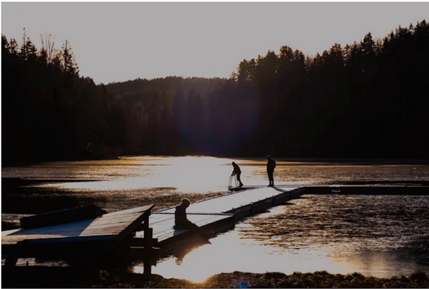
Kald desemberdag. Skraperudtjern nedenfor Rustadsaga skal være full av sagflis etter sagbrukets tid på 1800-tallet.

- Denne elven er visstnok en av dem i Indre Oslofjord som i høyest grad har bevart de opprinnelige omgivelsene sine, sier han mens han går forsiktig ned den litt bratte stien mot Skraperudtjern.