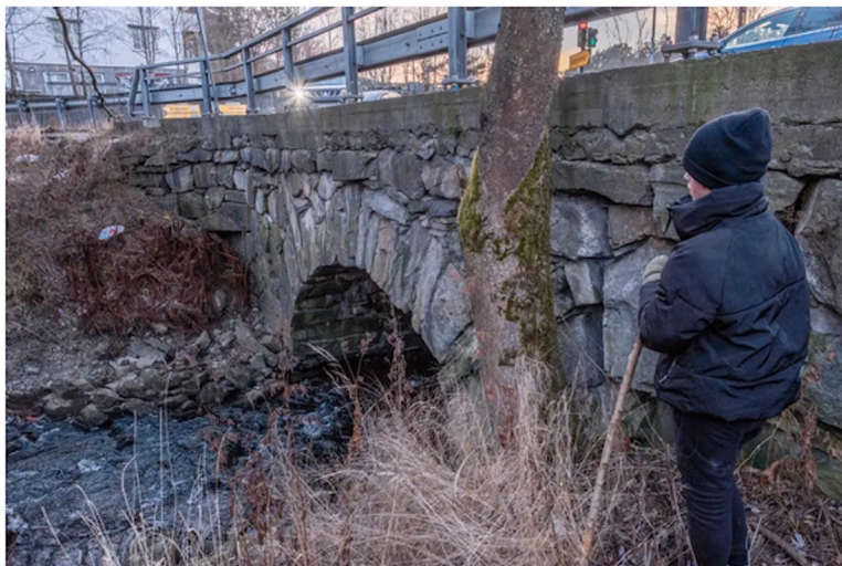
Lja bru. Den ble bygget i 1804 og har båret alt fra hestekjerrer til tungtrafikk. Fredrikshaldske kongevei til Kristiania gikk her.

Her er punktene langs ruten som hun synes er spesielt interessante: