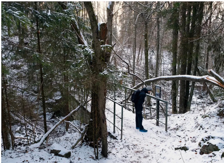
Ved Munkerudsaga. Langs hele elvetraseen er det godt skiltet med kart og informasjon om kulturhistoriske spor.